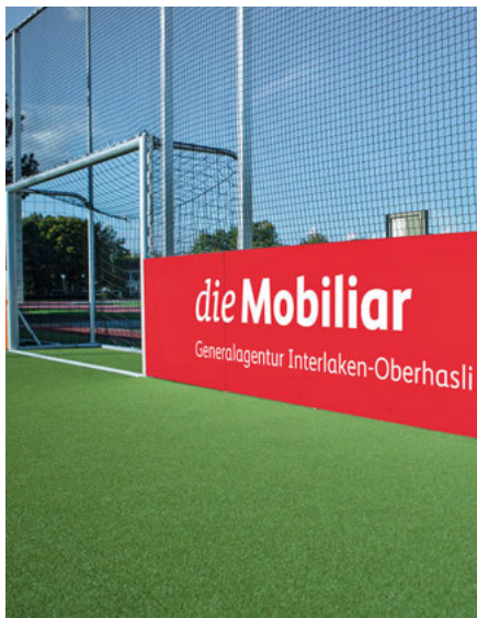
Personalisierte Werbung einfach und effektiv.

Den Mitarbeitern und Lieferanten stehen im neuen Markenportal alle markenrelevanten Informationen und Richtlinien an einem zentralen Ort zur Verfügung. Das Portal dient daher als wichtiges Werkzeug für die Markenführung. Es beinhaltet die Markenidentität, die Definition der Grundelemente, die Guidelines der verschiedenen Anwendungen sowie die Datenbank mit den neuen Logos, der Bildwelt und den Inseratevorlagen für die Generalagenturen. Die Vorteile der neuen Lösung liegen auf der Hand. Die webbasierte Lösung kann laufend angepasst werden. Die Bündelung der Inhalte schafft Transparenz und die Anwendungsbeispiele erhöhen das Verständnis und die Akzeptanz bei allen Beteiligten.