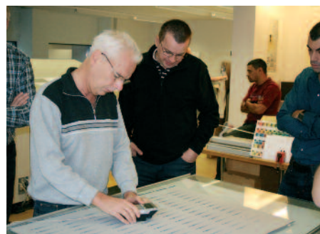
Plattenkontrolle mit den richtigen Werkzeugen zur Sicherung der Qualität.