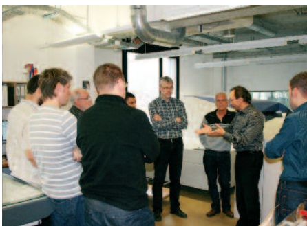
Der Dialog ist ein wichtiger Bestandteil des praktischen Kurses des VSD.

Durch die konsequente Wahrnehmung ökologischer, ökonomischer und sozialer Verantwortung können Unternehmen einen neuen Mehrwert schaffen. Immer mehr Betriebe in der Branche beschäftigen sich mit Themen wie Umweltschutz, Energieeffizienz und klimafreundlicher Produktion. Der Stellenwert einer umfassenden Beratung im Bereich der für die Umwelt relevanten Themen und für eine nachhaltige Medienproduktion ist sehr hoch. Dem Kundenberater aus den Druckereien stehen immer mehr Einkäufer gegenüber, die sehr gute Kenntnisse im Umweltbereich haben und auch unbequeme Fragen stellen. Dabei geht es dann häufig um die Themen Recycling, FSC Papiere, Ökologischer Fussabdruck und Kli-