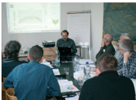
Grundlagenwissen über die Tonwertzunahme nach Standard und die geeignete Messtechnik.

Weitere Informationen zum Seminar sind auf der Webseite des VSD – www.druckindustrie.ch – zu finden einschliesslich elektronischem Anmeldeformular.