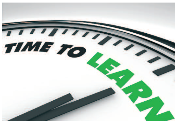
Höchste Zeit für eine Veränderung.