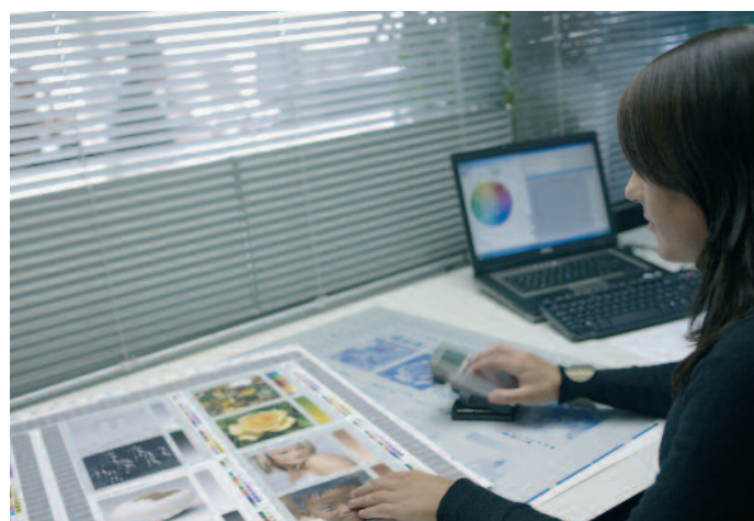
Polygrafen sollten auch technischen Anforderungen genügen.