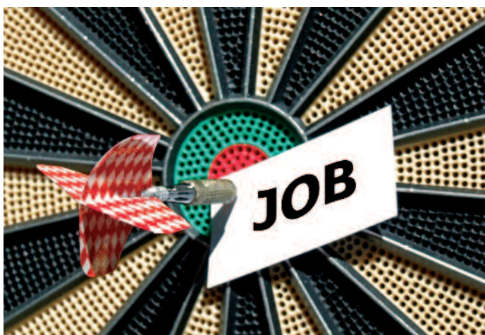
Bildung auf den Punkt gebracht.

Die Grundbildung Polygraf wurde offensichtlich aufgegeben zwischen dem Anspruch, Druckvorlagen herstellende Tätigkeiten in der Druckindustrie zu behalten und den neuen entstandenen Anforderungen. Zeit also für eine Neujustierung und Anpassung des Bildungsplans bei der Fachrichtung Medienproduktion. ■