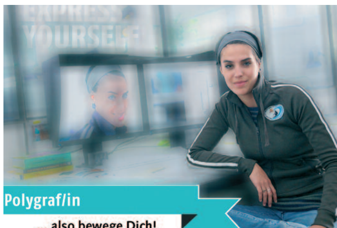
Polygrafen bewegen sich in die falsche Richtung ...

Bei einer Druckerei werden heute schätzungsweise 80% bis 90% der Daten fertig angeliefert, da bleibt für eine kreative und vielfältige Arbeit nicht viel Spielraum. Das sind neu entstandene Realitäten, die einen Wechsel der kostspielig ausgebildeten Polygrafen in die vorgelagerte Produktion beschleunigen. Seit Jahren wissen wir auch: die Kompetenzen der Medienvorstufe in Druckereibetrieben haben sich von der Gestaltung hin zum Datenmanagement verschoben – und trotzdem verspricht unsere Branche mit dem Beruf des Polygrafen einem Schulabgänger, einen vielseitigen und kreativen Beruf erlernen zu können. Die Druckindustrie braucht daher nicht in erster Linie breitbandig ausgebildete Allrounder ohne Spezialisierung, sondern vermehrt Spezialisten mit Kompetenzen im Bereich Medien-IT (Daten-, Schnittstellen- und Output-Management).